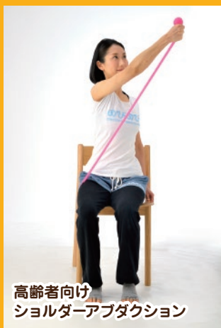
高齢者向け ショルダーアブダクション