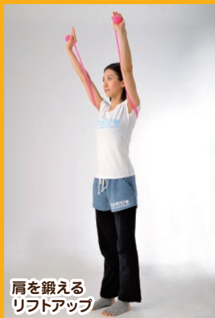
肩を鍛える リフトアップ