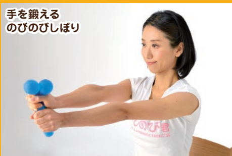
手を鍛える のびのびしほり