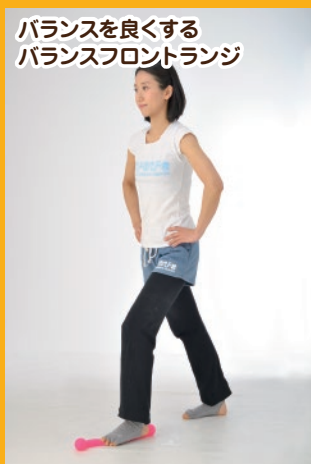
バランスを良くする バランスフロントランジ