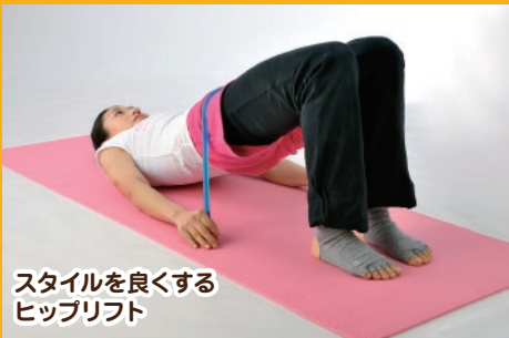
スタイルを良くする ヒップリフト