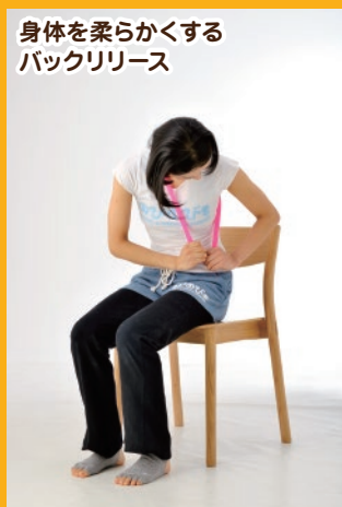
身体を柔らかくする バックリリース