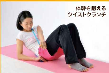
体幹を鍛える ツイストクランチ