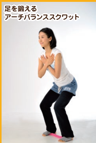
足を鍛える アーチバランススクワット