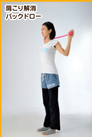
肩こり解消 バックドロ